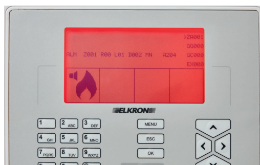
ΚΟΚΚΙΝΟ Σύστημα σε συναγερμό