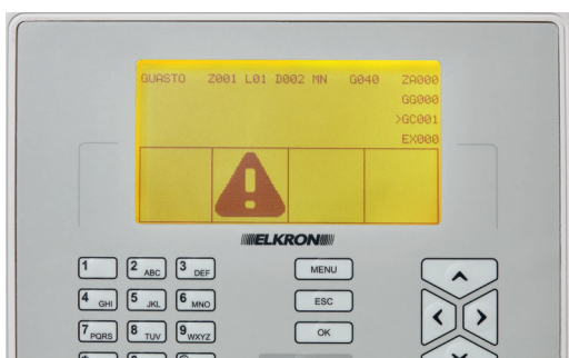
ΚΙΤΡΙΝΟ Βλάβη/δυσλειτουργία συστήματος