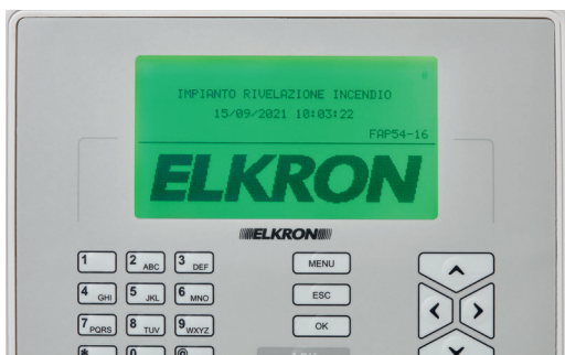
ΠΡΑΣΙΝΟ Σύστημα OK

Η νέα οθόνη RGB αλλάζει χρώμα ανάλογα με την κατάσταση της μονάδας ελέγχου. Τα χρώματα απλοποιούν την εργασία του εγκαταστάτη, καθώς διευκολύνουν την αναγνώριση της κατάστασης του συστήματος και τον εντοπισμό τυχόν βλαβών ή συναγερμών, ακόμα και όταν δε βρίσκεται κοντά στη συσκευή.