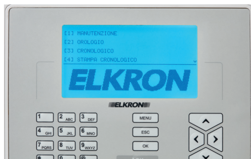
ΜΠΛΕ Σύστημα σε συντήρηση / προγραμματισμό